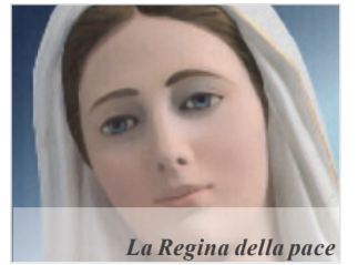
La Regina della pace a Medjugorje