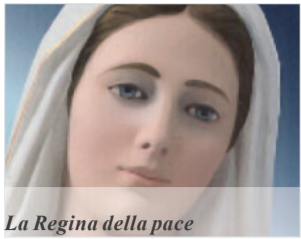
La Regina della pace a Medjugorje